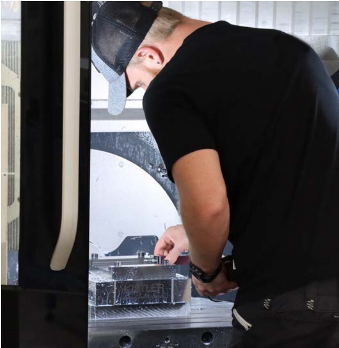
Mit Hilfe eines Mehrkomponenten-Dynamometers von Kistler führt BIG KAISER objektive Vergleichstests von Zerspanungswerkzeugen durch.