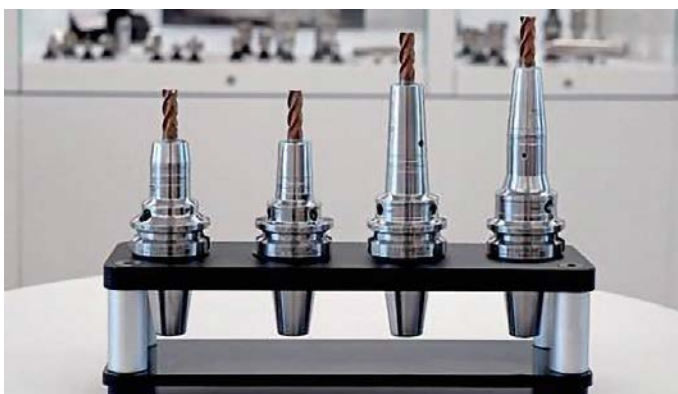
Mit Messtechnik von Kistler verglichen wurden unter anderem vier Hydrodehnspannfutter von BIG KAISER.

Die Ergebnisse der vergleichenden Leistungstests mit Messtechnik von Kistler kann man bei BIG KAISER auch für die Entwicklung nutzen: „Auf der einen Seite sehen wir noch genauer, wo wir gut sind im Vergleich zum Wettbewerb und